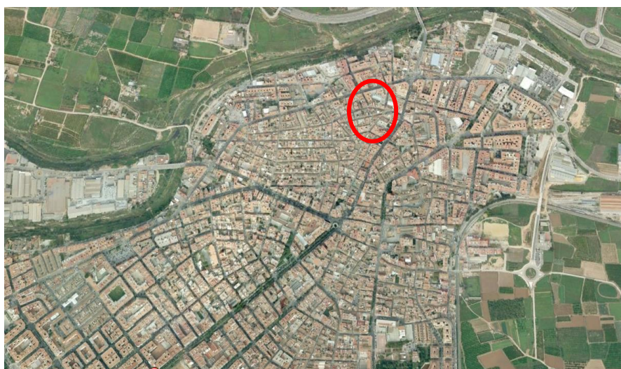
Situación de las calles Catarroja y Santísima Trinidad de Torrent