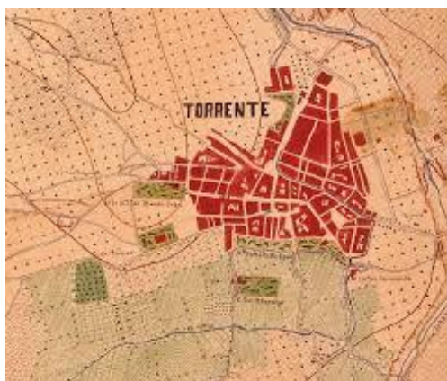
Plano de Torrent en el siglo XIX